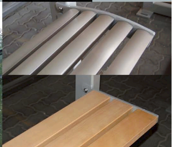
▲ Sitzausführungen in Holzlattung oder Aluminiumprofilen (eloxiert und gebürstet)