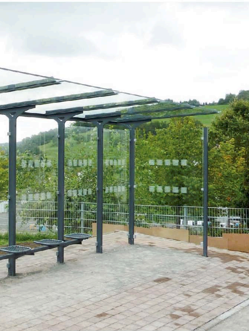
◀ 5-Feld Wartehalle mit beleuchteter Werbevitrine und Drahtgitter-Einzelsitzen