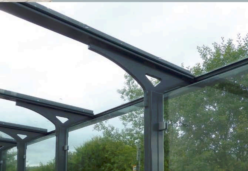
▲ Detail der Dachkonstruktion ◀ Dachverglasung in VSG (klar)